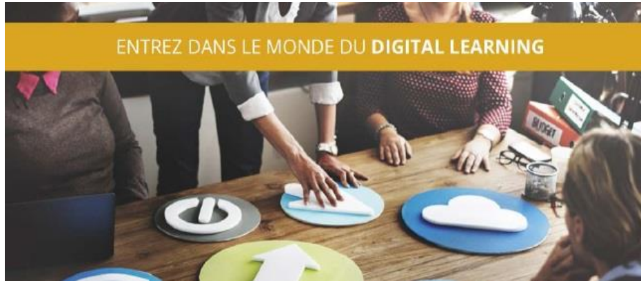
JOURNEE VIP AUTOUR DE LA FORMATION DIGITALE